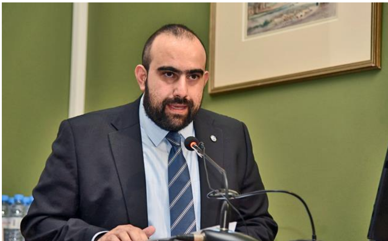
Ο δήμαρχος Κυθήρων-Αντικυθήρων, Στράτος Χαρχαλάκης |

Κι αυτό κάνουν σήμερα ο δήμαρχος Κυθήρων-Αντικυθήρων, Στράτος Χαρχαλάκης, ο αρχαιολόγος Αρης Τσαραβόπουλος και άλλοι συνομιλητές μας.