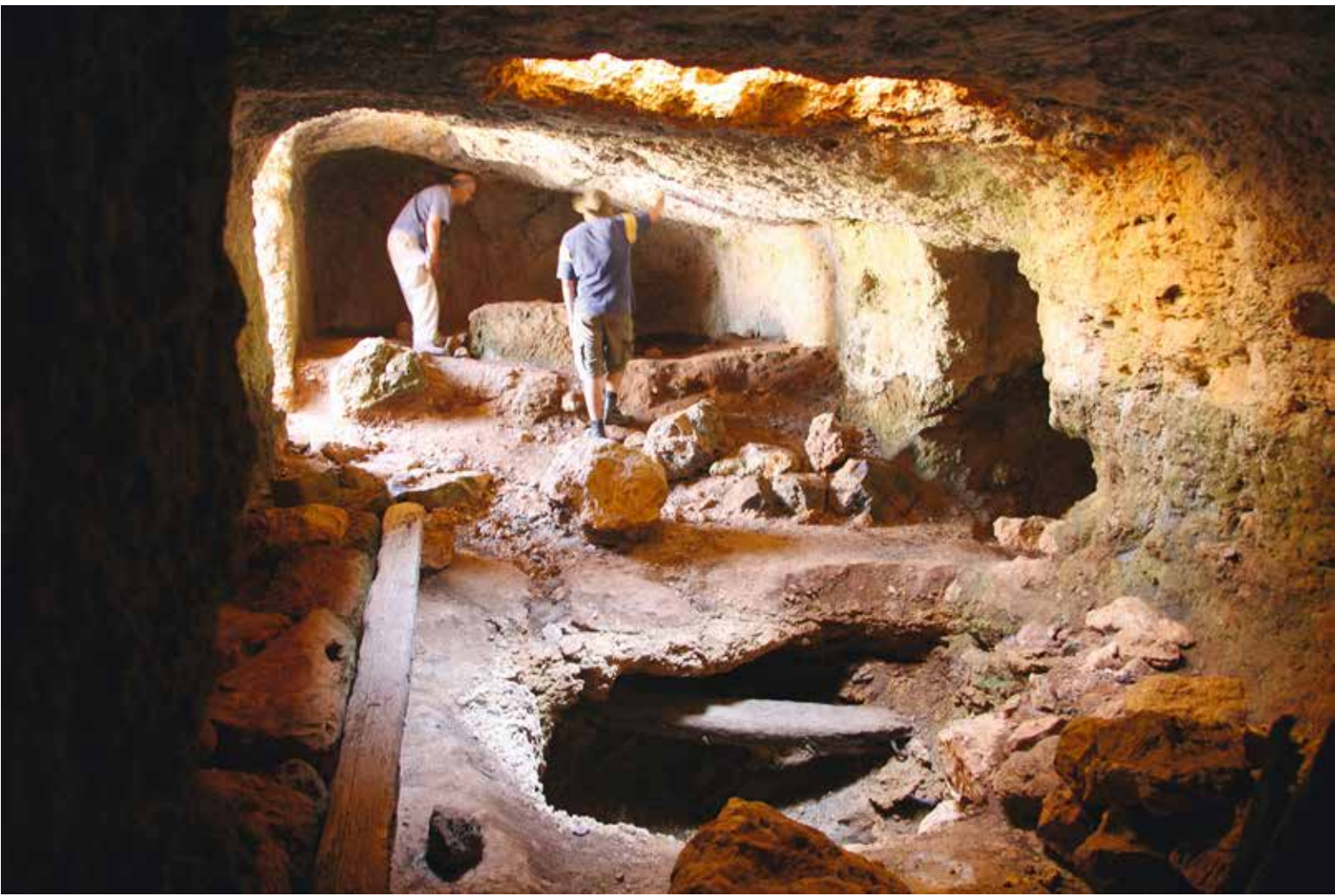
Η «Φυλακή», υπόσκαφο ιερό χθόνιας θεότητας με φεγγίτη προσφορών.

The South Gate was the principal entrance of the fort. It was difficult for an attacking army to reach it.