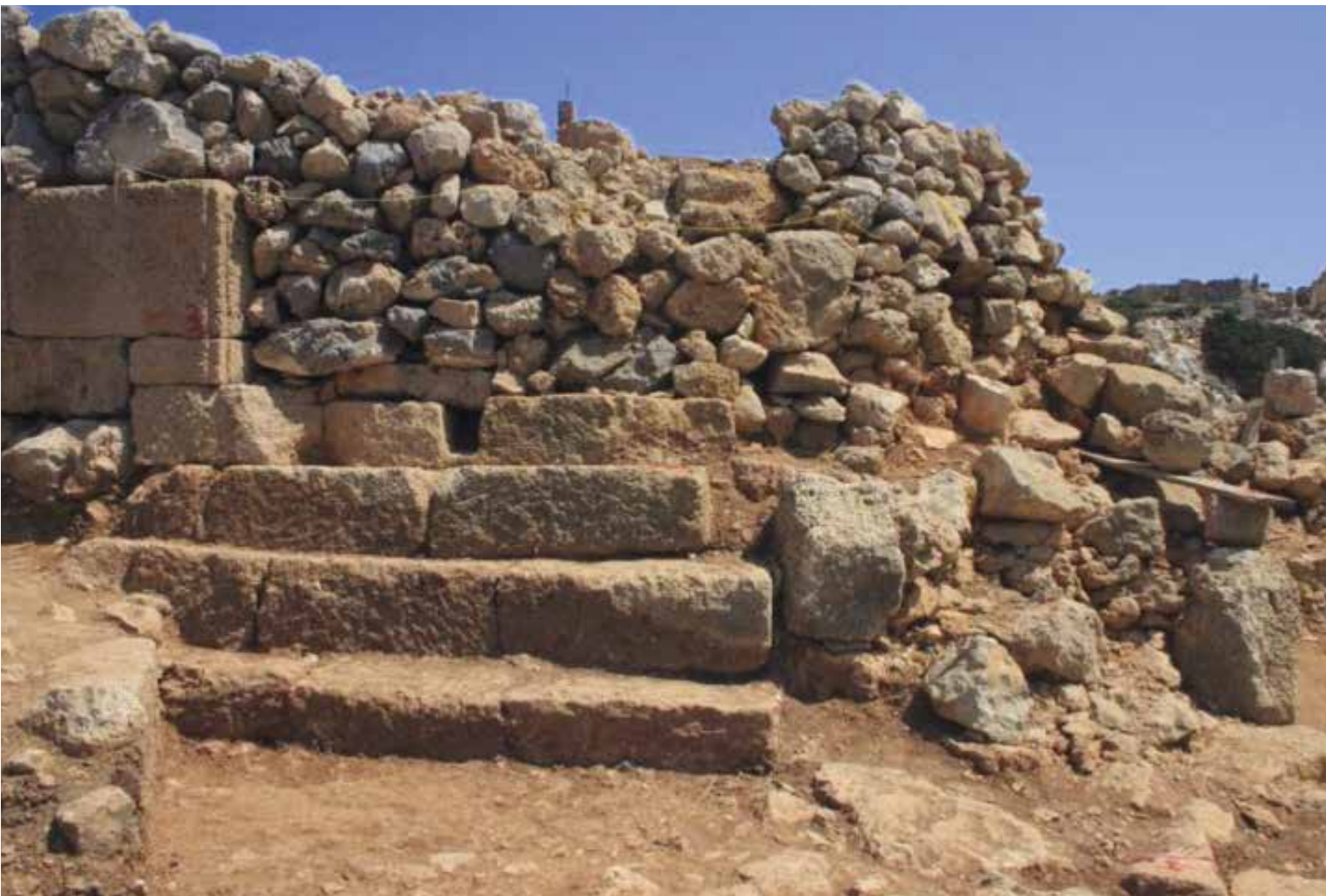
Η Νότια Πύλη αποτελούσε την κύρια είσοδο του Κάστρου και είχε δύσκολη πρόσβαση για τον επιτιθέμενο.

A harbor sanctuary of Apollo and Artemis existed on the southern side of Xeropotamos bay. The foundations of the temple, the altar and the strong “peribolos” along the harbor can be seen today. In 365 A.D. after a strong earthquake, the island was uplifted by 3 meters from the level of the sea, and the harbor has been covered.