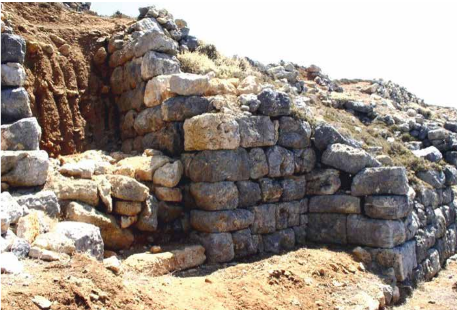
Η πύλη της «ακρόπολης» προς την πόλη.

In the 19th c. new inhabitants, the first settlers after the ancients, inhabited the area of “Kastro”, and built their houses on the fortification walls. The place was called “Kastriana” or “Ploumidiana”.